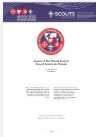
Diplôme Scouts du Monde