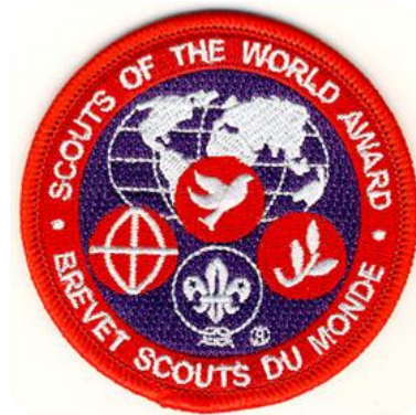
Badge Scouts du Monde